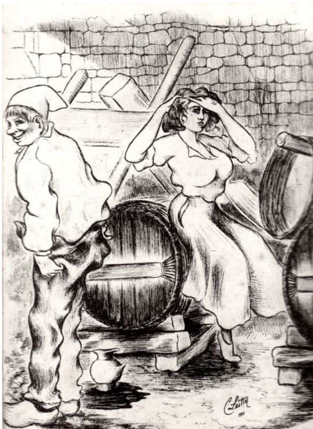
3. - Servante gourmande et patron amoureux Sacredienne !!... ol a pas été sans peine, mais y est pas perdu mon temps... y veint d'bouché l'creux per là où qu'mon vin s'en allait !